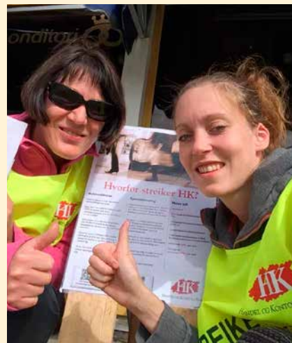
Bilder fra streikevaktene i Østfold.