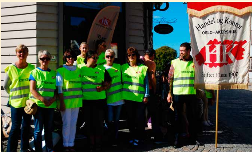
Bildet er tatt på streiken utenfor Råde bakeri.

Hvis våre fagforeninger knuses, ødelegges det faglige løftet om enighet om lønns- og arbeidsvilkår, og da er veien åpen for forverring. Alt vi har oppnådd vil til enhver tid være under angrep så er det viktig for alle å være sterke nok til å stå imot, tørre å argumentere og agitere. Sammen står vi, hver for seg faller vi!