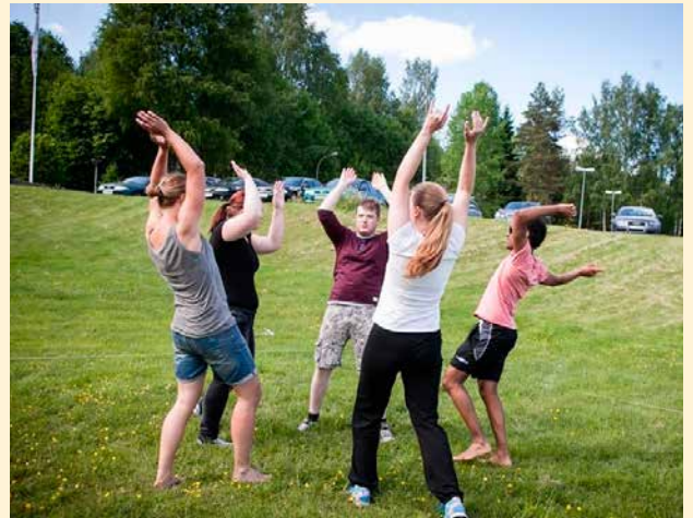
Sommerlekene har blitt en tradisjon på sommerkonferansen.