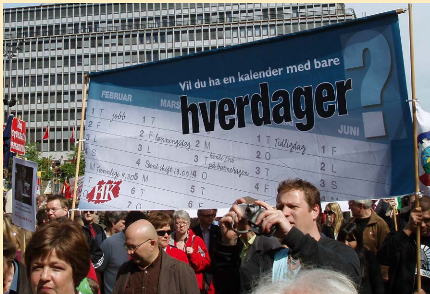
HK 1. mai 2007: Vil du ha en kalender med bare hverdager?

Ansatte i varehandelen er ikke omfattet av arbeidsmiljølovens bestemmelser om natt- og helgearbeid og har dårligere beskyttelse mot natt- og helgearbeid enn alle andre yrkesgrupper. 1970-årenes håp om lørdagsfri er i dag erstattet av kamp for å beholde søndagen som handlefri dag. A.K.