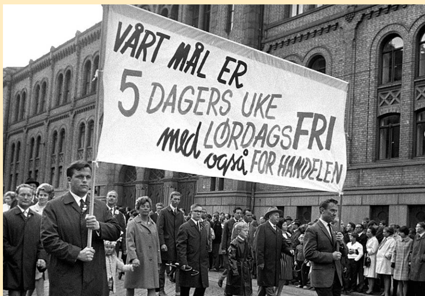
HK 1. mai 1968: Målet var fem dagers uke og lørdagsfri i varehandelen

Men meklingsforslaget møtte stor motstand. Halve forbundsstyret stemte imot å anbefale det. Da forslaget ble sendt ut til uravstemning mente mange at lønnstilleggene var for lave og opptrappingsplanen gikk over for mange