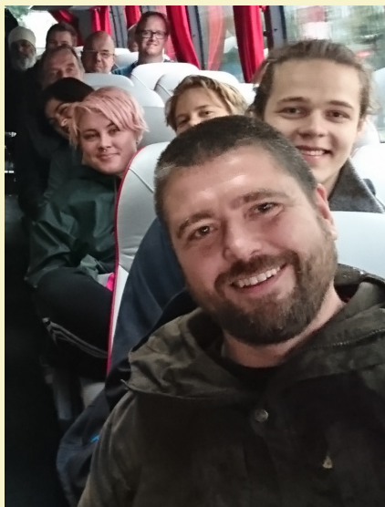
Busstur til fanemarkering på IKEA.

Dette Lokal Tillit har skolering og utdanning som tema. Det er ikke tilfeldig: I 2016 opplevde vanlige lønnsarbeidere en merkbar nedgang i kjøpekraft som en følge av at prisstigningen var høyere enn lønnsoppjøret – for første gang siden 1989. Nå frykter mange en reprise. Vare-