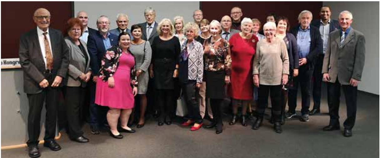
40-års jublanter 2019.