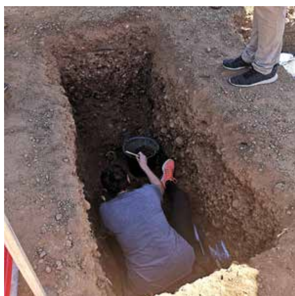
Utgravning på kirkegård i León - ett av Francos ofre.