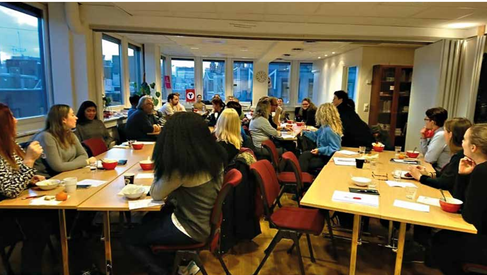
Medlemsmøte om fagbrev på jobb i samarbeid med AOF.