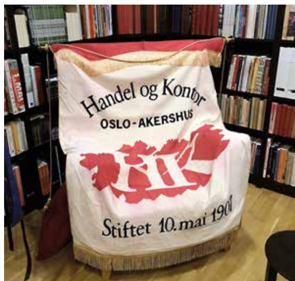
Fana henger til tørk etter demonstrasjon.