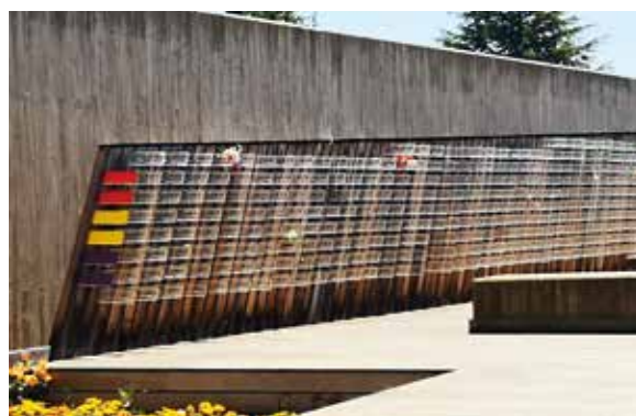
Minnesmerke over Francos ofre i León.