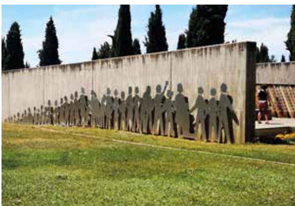
Minnesmerke over Francos ofre i León

Spansk fagbevegelse samarbeider med ARMH om dette arbeidet, og møte med blant annet UGT og CCOO stod også på agendaen. De sterkeste inntrykkene var det derimot besøk til utgravningssted og minnesmerke over Francos ofre. Samt blomsternedlegging ved statuen i Madrid til minne for falne fagforeningskamerater.