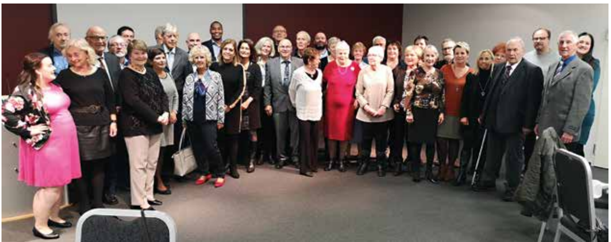
25 og 40-års jublanter 2019.