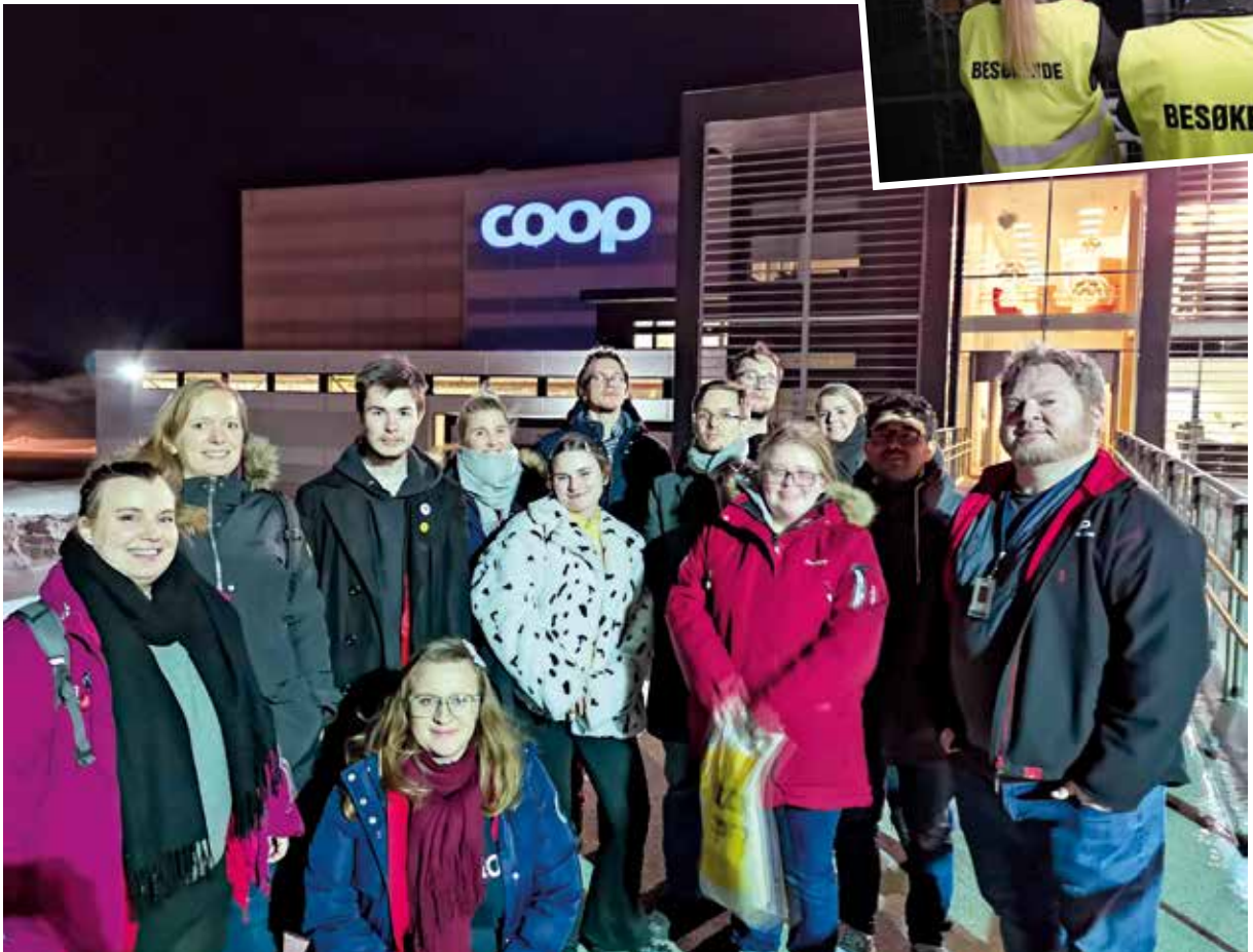
Ung tillitsvalgtforum på C-log.