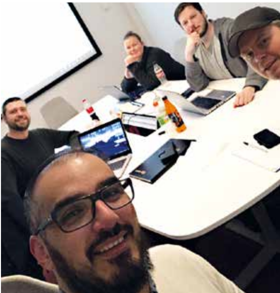
Stiftelsesmøte Bring Cargo international klubben.

Avdelingsstyret avholdt styrekonferanse på Kiel-ferga i desember 23. – 24. november. Tema for konferansen var det interne styrearbeidet, og vi hadde hentet inn pedagogisk kompetanse fra ABF i Sverige (tilsvarende Arbeidernes Opplysningsforbund -AOF- i Norge).