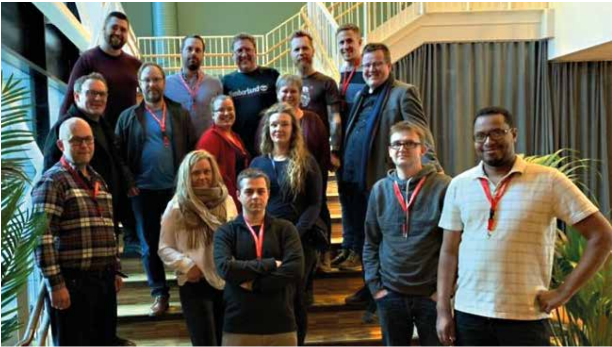
HKere under Trondheimskonferansen 2020.