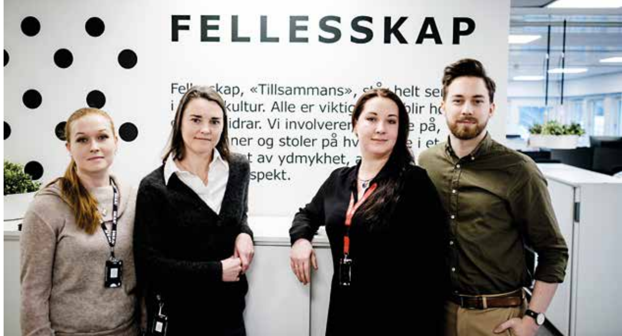
IKEA Slependen Kundesenter.