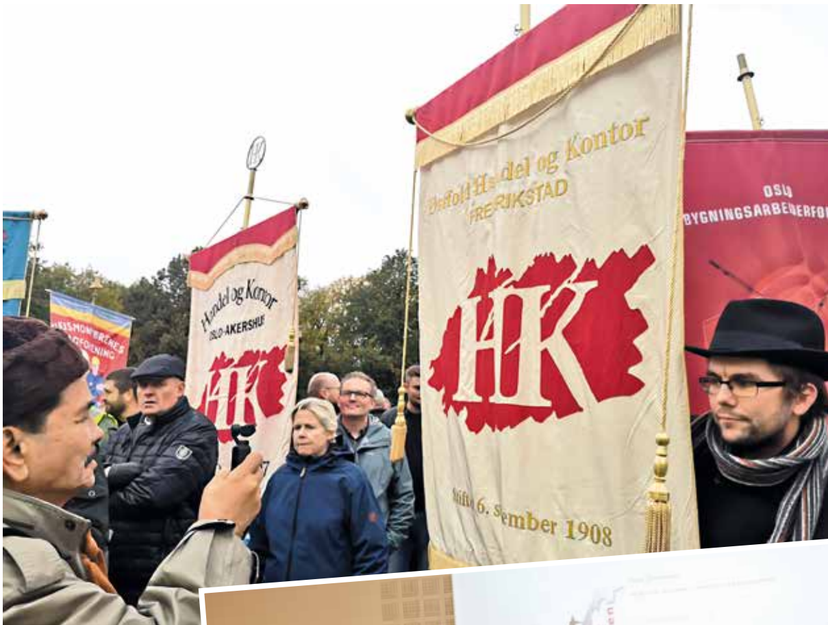
Fanemarkering mot jernbanepakke 4.