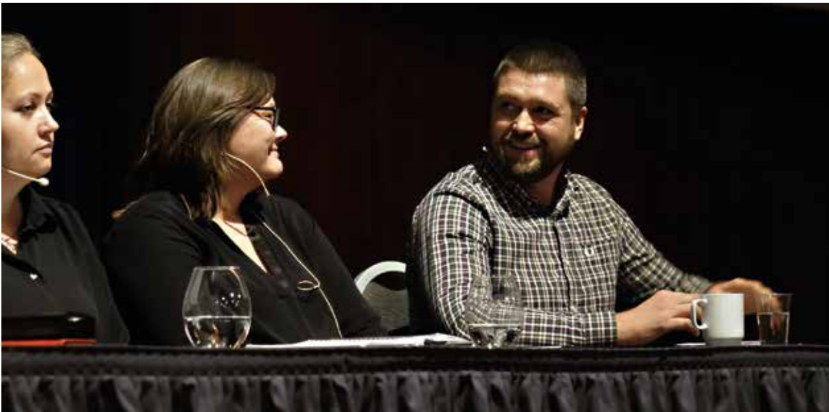
Debatt om 6-timers dag.