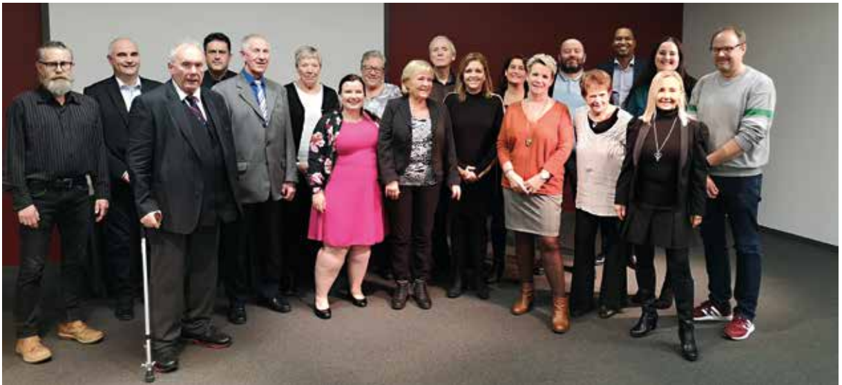
25-års jublanter 2019.