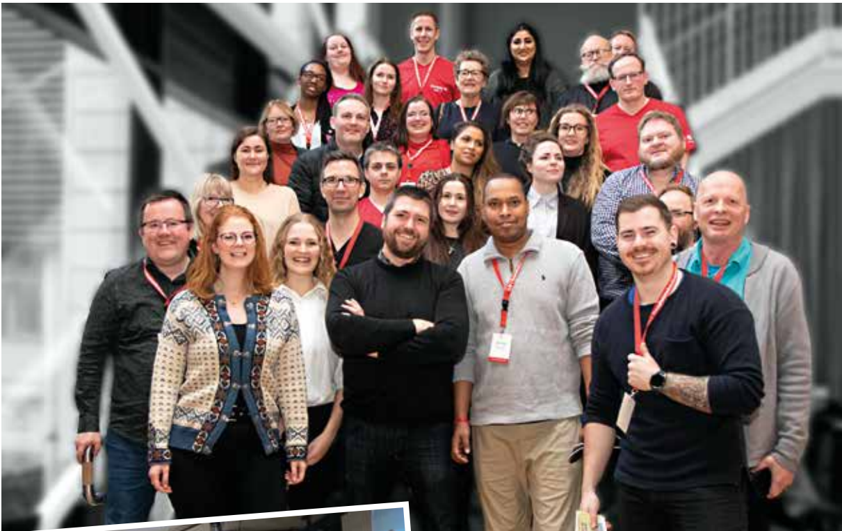
HKere under Trondheimskonferansen 2020.