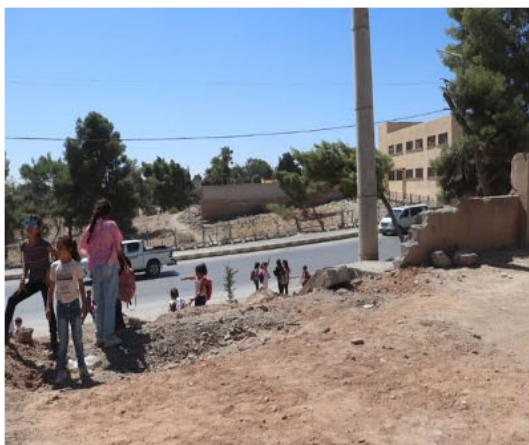
Tabqa 2024. Her skal barna få to kunstgressbaner.

Tusen takk for at dere har gjort dette mulig og for at dere står sammen med oss helt til siste fløytesignal